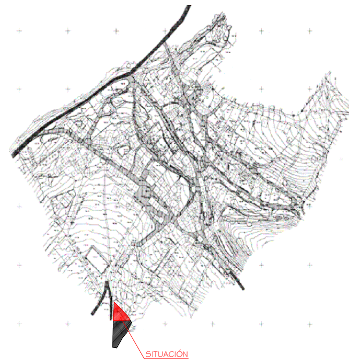
RED VIARIA. PAVIMENTACIÓN