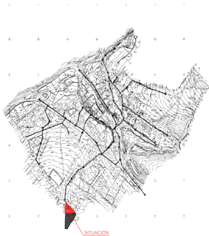
RED DE ELÉCTRICA Y DE ALUMBRADO