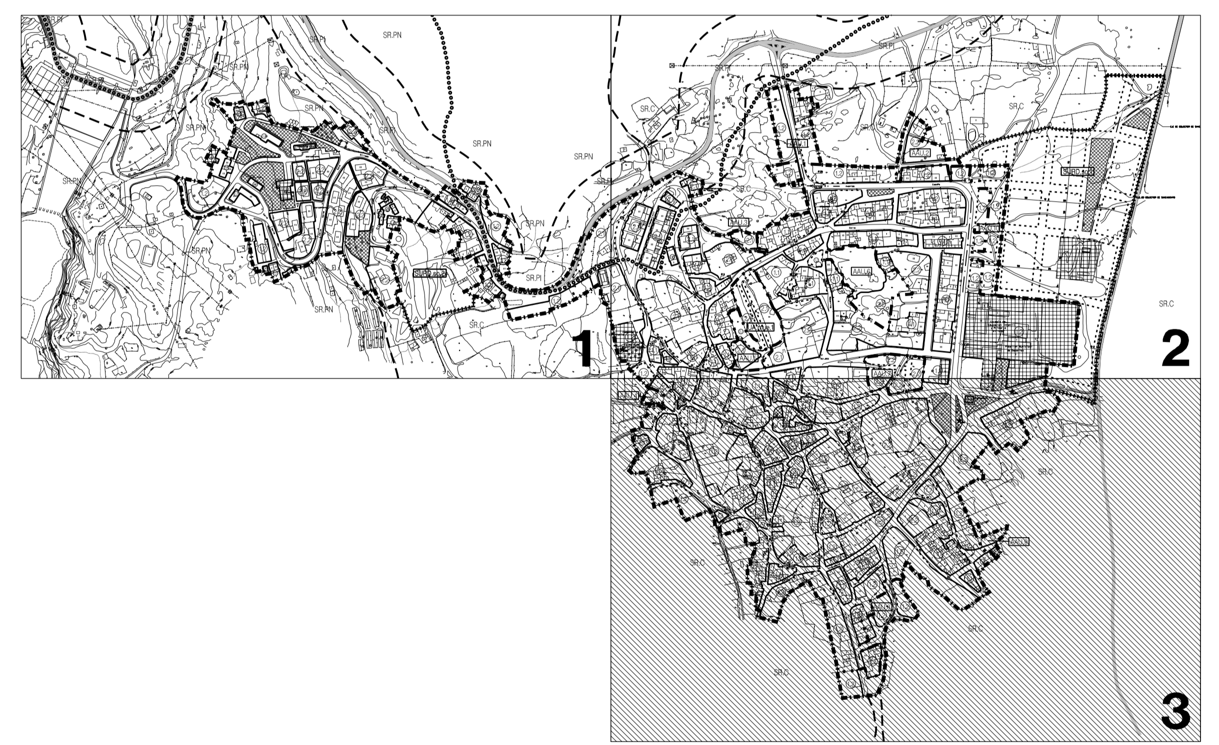
MUELAS DEL PAN