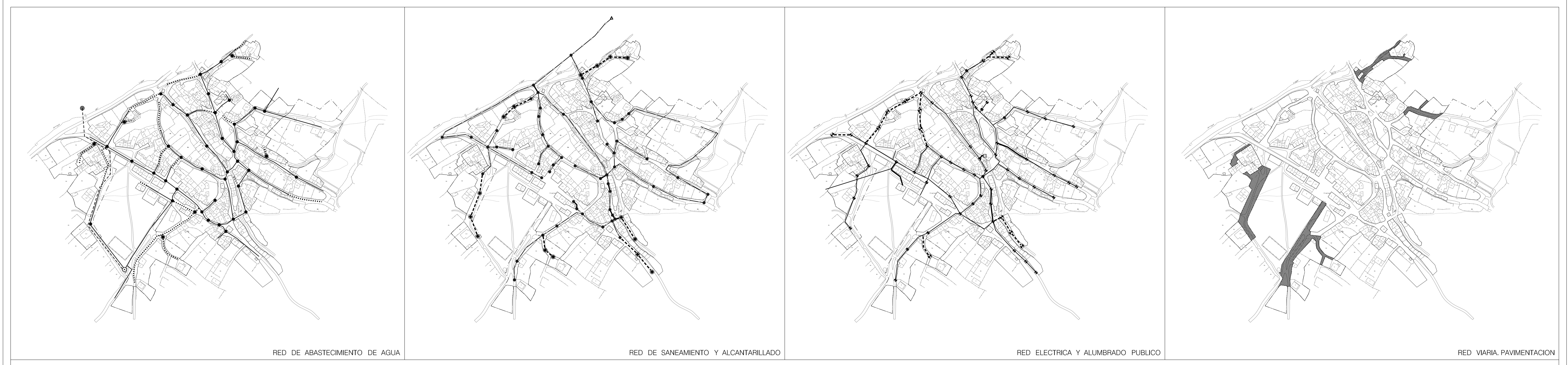
RED DE ABASTECIMIENTO DE AGUA