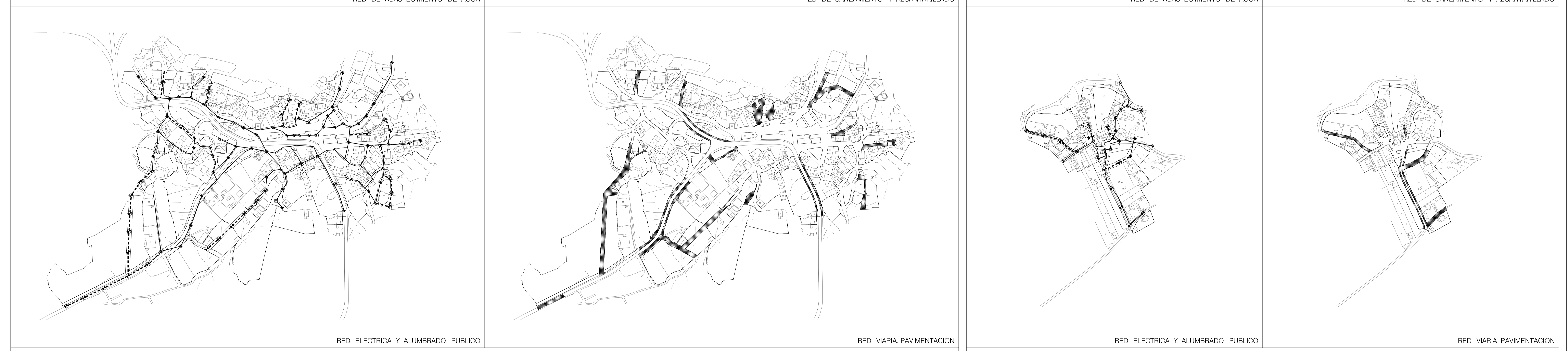
RED ELECTRICA Y ALUMBRADO PUBLICO